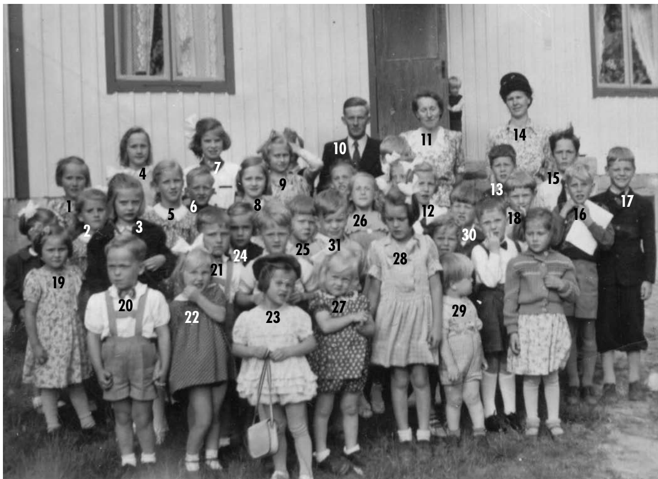
Gruppbild av elever vid en söndagsskoleavslutning vid Björkgläntan omkring åren 48–50