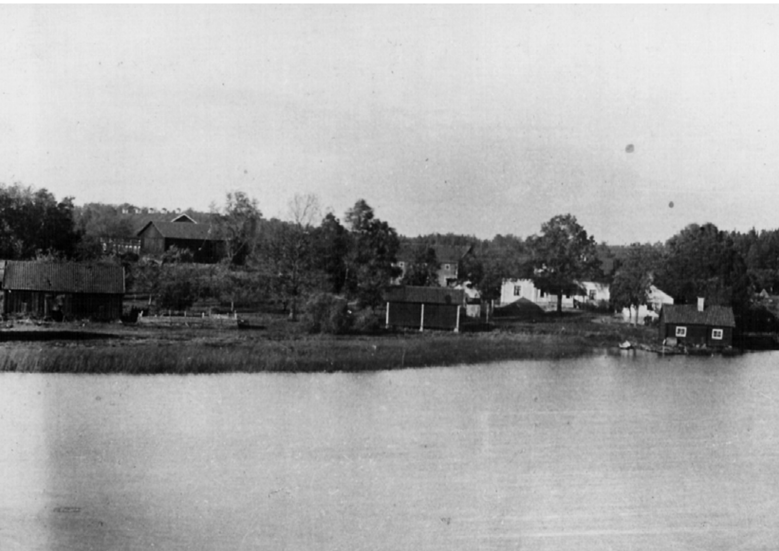
Eklångens gård 1899

En mindre ekonomibyggnad rymmande höns- och grishus, samt en rymlig vedbod byggdes också. Spannmålsmagasinet rustades upp och där installerades nya sorteringsmaskiner.