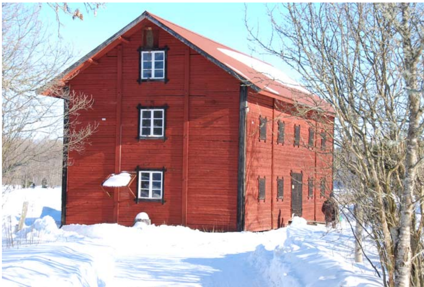
Magasinet, Eklångens Gård i vintras

Information från projektgruppen Nr. 3 Juli 2010