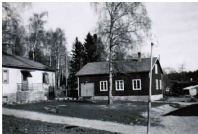
Björkgläntan på femtiotalet. Verkstaden i mitten.