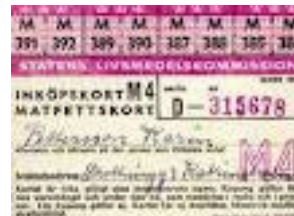
Ransoneringskort för matfett 1940

1946 var året efter att andra världskriget var slut. Framtiden såg ljus ut.