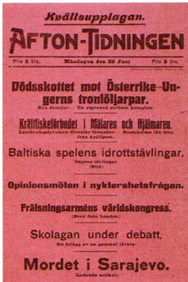
Löpsedel för "Aftontidningen" den 29 juni 1914